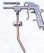
NX966塩害ガード専用ガン