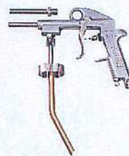
NX966塩害ガード専用ガン